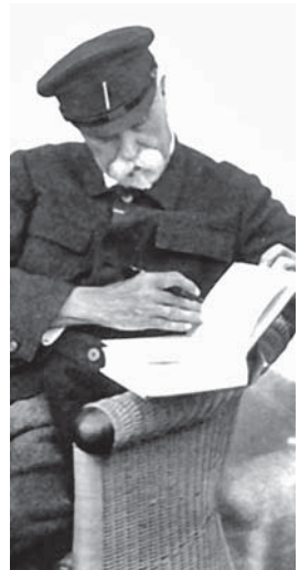
Перший президент Чехословаччини Томаш Масарик

Зрештою, розвідка США сказала своє слово й у процесі післявоєнного врегулювання. До складу делегації на Паризьку мирну конферен-