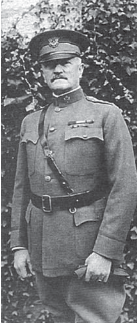
Генерал Джон Першинг, командир експедиційного корпусу США в Європі

він вступив до військового коледжу, протягом 1906–1915 років був у відрядженні в Китаї. Досвід роботи «у полі» у різних регіонах світу дозволив йому виробити власну систему узагальнення інформації, яку довелося випробувати вже на театрі воєнних дій проти німців у Франції. У квітні 1917 року Деман, який не терпів бюрократичної тяганини, через голову начальника Генштабу Х.Скотта звернувся до військового міністра з пропозицією виокремити військову розвідку в самостійний орган і підсилити її. Через дві доби він став шефом військової розвідки МІ, отримав дозвіл присвоювати її співробітникам військові звання. Через рік у «позитивному» (розвідувальному) і «негативному» (контррозвідувальному) підрозділах МІ працювало 282 офіцери й 1100 цивільних фахівців.