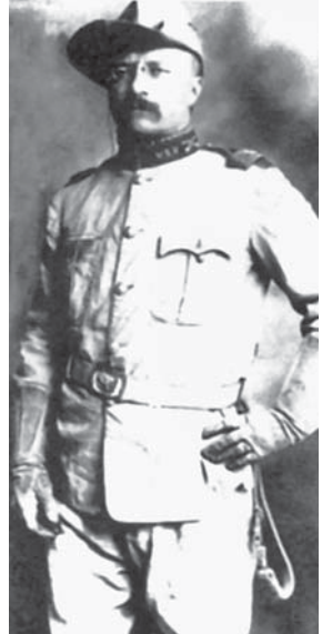
Теодор Рузвельт (фото часів американо-іспанської війни)

Не випадково 23 березня 1882 року створюється управління морської розвідки при управлінні особового складу й штурманської служби – перша постійна розвідувальна служба США. Активним прихильником посилення розвідувальної присутності США у світі став державний секретар Дж. У.Фостер (дід А.Даллеса). Під його впливом Конгрес у 1888 році ухвалив рішення про створення військових і військово-морських аташатів при посольствах США. У наступному році призначаються військові аташе в Берлін, Відень, Париж, Лондон і Петербург. Згодом аташати з'явилися у Римі (1890), Брюсселі (1892), Токіо й Мехіко (1894), до кінця сторіччя діяло вже 16 військово-дипломатичних представництв, які збирали інформацію про Іспанію (майбутнього противника) й наміри нейтральних держав. Усього ж до 1914 року існував 31 військовий аташат, третина з них – у країнах Латинської Америки.