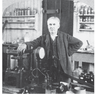
Винахідник Томас Едісон

рам, то відповіли новим повстанням, з яким 70-тисячна американська армія боролася до 1901 року. Тоді вдалося схопити зв'язкового повстанців і на допитах у МІ вивідати дані про повстанського ватажка. З місцевих колаборантів сформували лжепартизанський загін, який захопив Е.Агінальдо. Очевидно, це був перший успішний досвід американської розвідки на шляху створення «п'ятої колони» у боротьбі з повстанцями.