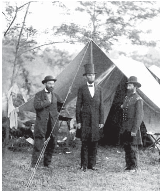
Президент США Авраам Лінкольна (у центрі) та Аллан Пінкертона (зліва), жовтень 1862 р.

поліцейські. Алан створив Національне детективне бюро Пінкертона, яке в основному боролось з популярним тоді народним промислом — пограбуванням потягів. Пінкертона примітили на Капітолії 1861 року, коли він відвернув замах на президента Авраама Лінкольна. У квітні цього ж року за пропозицією генерала Дж.Макклелана Пінкертона організував розвідувальну службу Півночі — «Янки». Однак агентурна розвідка й конспірація були поставлені вкрай слабо, Пінкертона, чие ім'я стало названим для детектива й контррозвідника, виявився не здатним керувати розвідкою. На початку 1863 року на зміну аматорам Пінкертона приходить професійне бюро інформації Дж.Шарпа (у майбутньому бригадного генерала), а в березні 1864-го головнокомандувач північних генерал-лейтенант В.Грант зробив бюро структурним підрозділом свого штабу. Однак жодної помітної розвідувальної операції воно не здійснило і після закінчення бойових дій бюро розпустили.