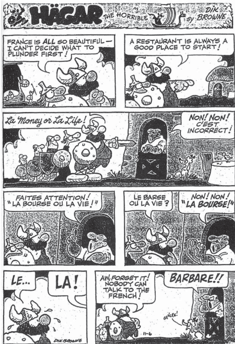
Рис. 4.1. Погано почати: найперше англійсько-французьке зіткнення.